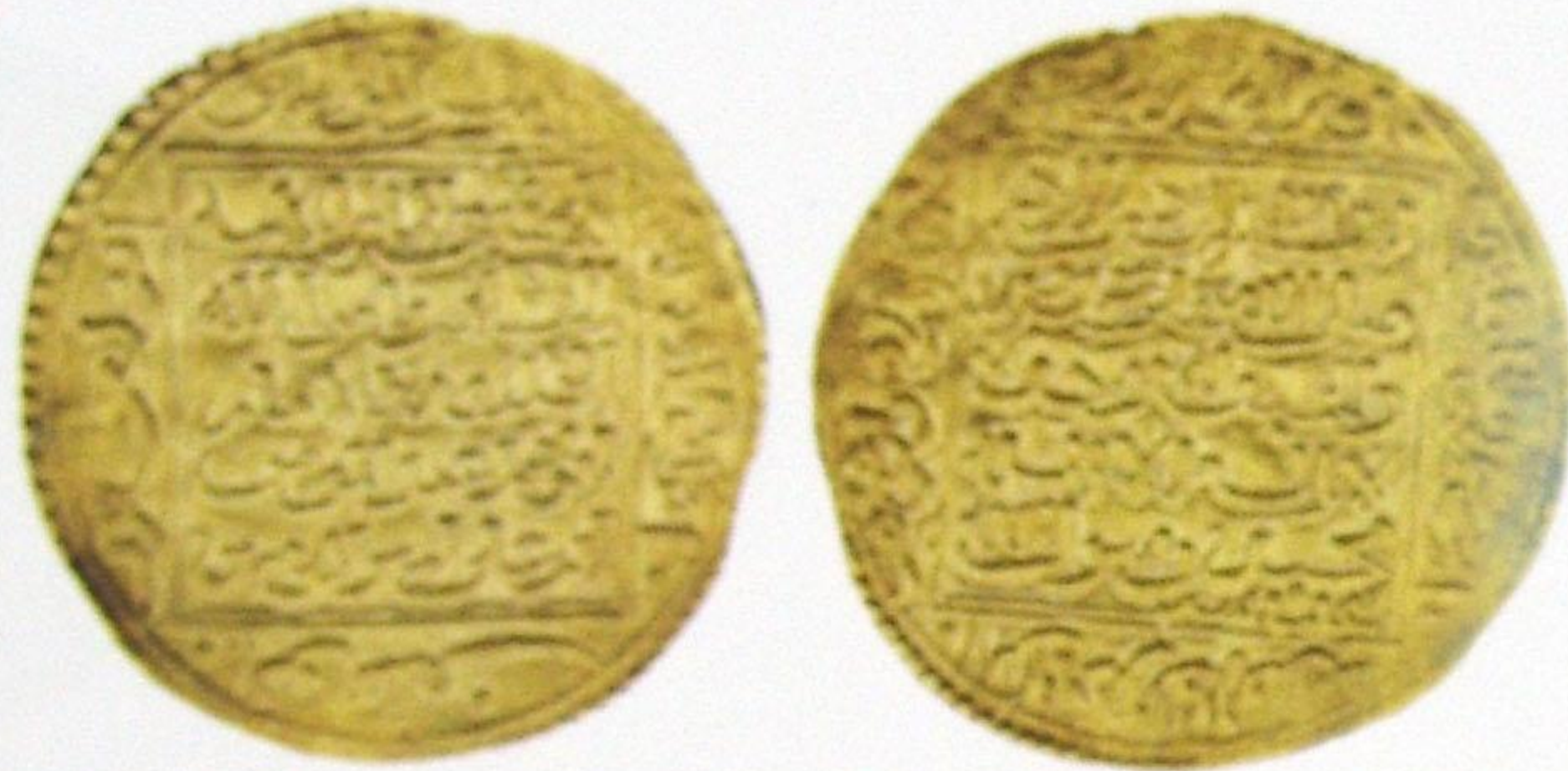
دينار موهبي عمر الرشيد ضربت سبها Mowahbi Dinar Dinar Al-Rashid struck at Siba